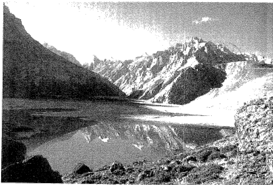
وادي بنجشير .